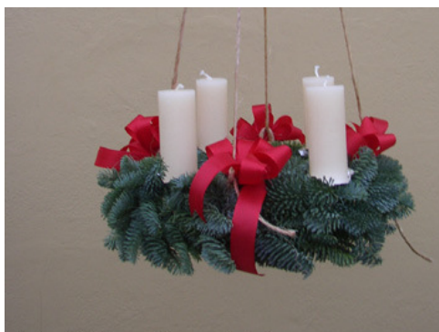
Indsendt af: Jonna Bierregaard, Broby

Flere sønderjyske højskoler tog derefter denne Åbenrå-tradition op. I begyndelsen af 1920'erne blev den også indført på Askov Højskole og på Snoghøj Gymnastikhøjskole. Den er på den tid blevet så almindelig i hjemmene i Sønderjylland, at man kunne kalde adventskransen som en sønderjysk tradition.